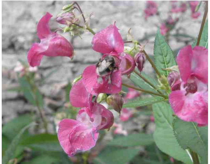
Springbalsemien wordt hier bezocht door een honingbij.

Springbalsemien heeft grote tunnelvormige bloemen, behalve roze is wit en lila mogelijk. Honingbijen bezoeken deze bloemen in grote getale.